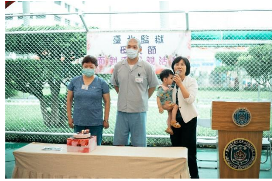
勉勵並肯定家庭支持親情力量