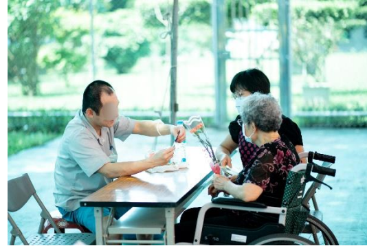
收容人向年邁母親獻花康乃馨