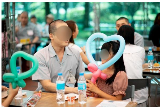
造型氣球深受大小朋友喜愛