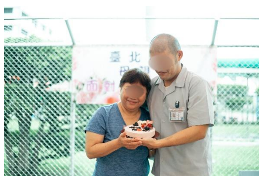
烘焙班學員親手製作低糖蛋糕