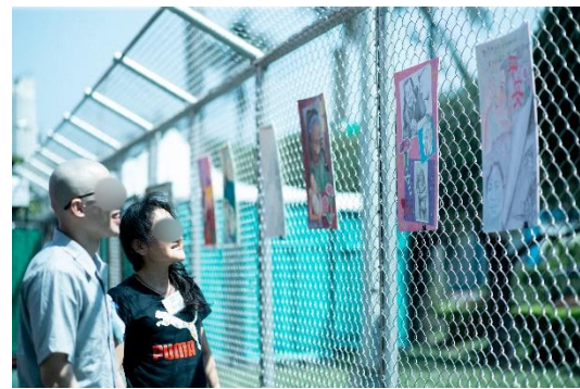
收容人「畫我母親」繪畫作品展示