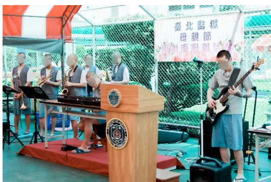
音樂班學員演奏自創曲目