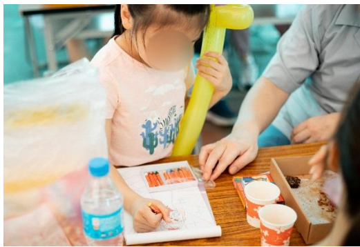
兒童塗鴉繪本增進父女互動