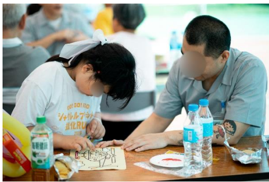
親子同樂 DIY 砂畫體驗