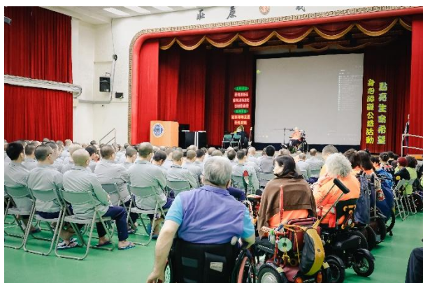
活動現場來賓和收容人座無虛席