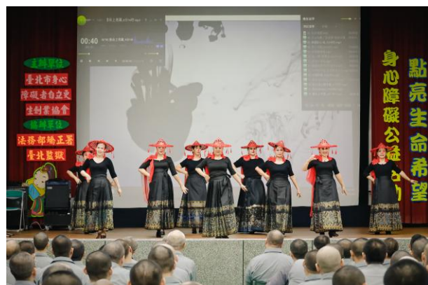
生命禮讚舞蹈團演出 雲朵上的羌寨