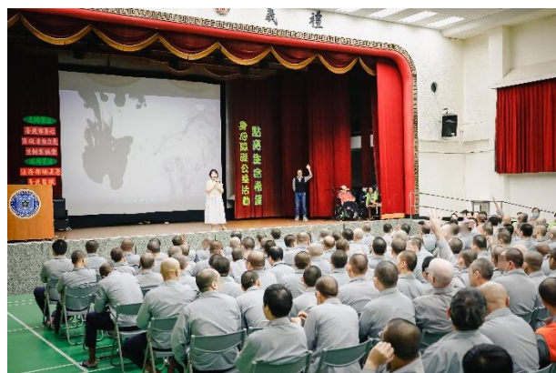
講師生命故事分享並與同學互動