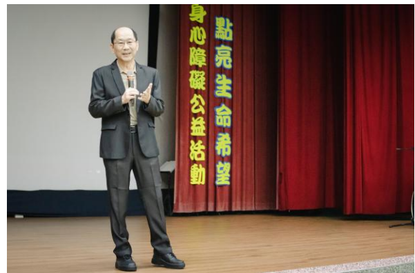
典獄長親臨活動現場致詞並關懷身心障礙收容人與來賓