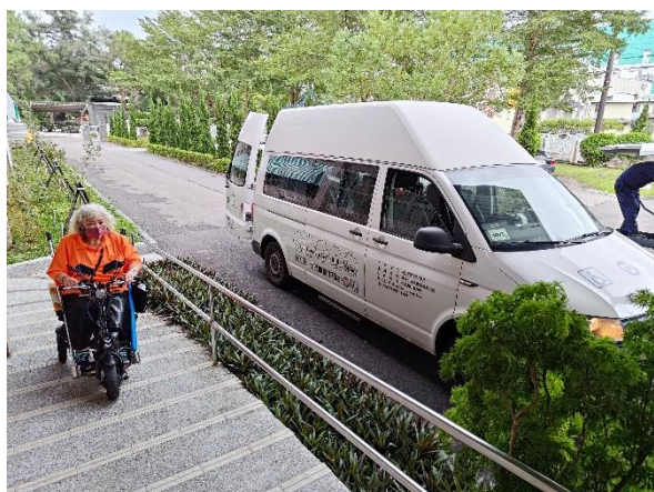
機關正門無障礙通行坡道