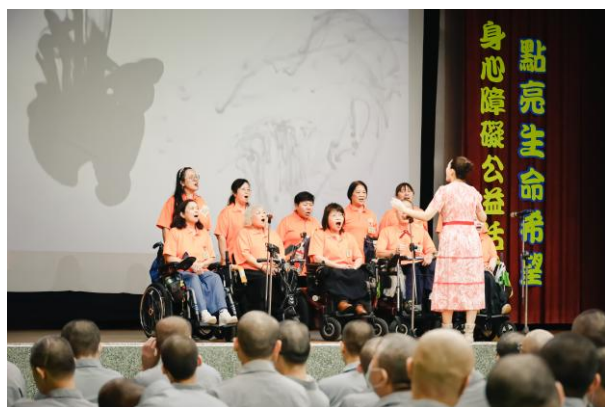
生命禮讚綜藝團大合唱團歌